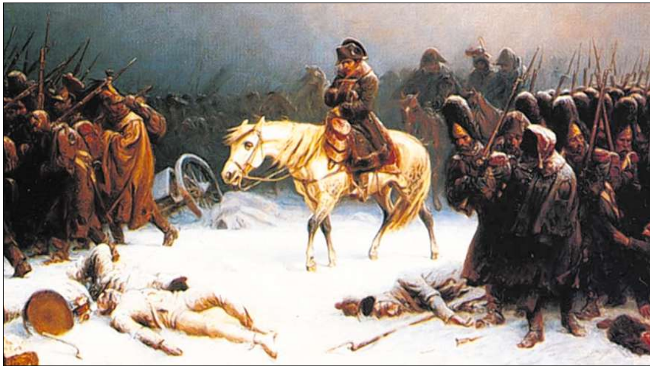
Cun la retirada da la Russia (1812/1813) va la predominanza napoleonica en l'Europa a fin. (Maletg dad Adolph Northen).

Epoca da l'istorgia svizra e grischuna che s'estenda dal 1803 fin il 1814/15. Els 10 da november 1802 ha la Dieta confederala delegà il federalist Florian von Planta e l'unitarist Jakob Ulrich Sprecher von Bernegg a las tractativas a Paris, l'uschenumnada Consulta. Els 19 da favrer 1803 ha Napoleun decretà l'Acta da mediaziun (versiun originala Rumantscha 1803: Act de mediatiun) per la Confederaziun. Il chapitel VII cuntegna la constituziun dal chantun Grischun en 13 artitgels, sutscritta da Bonaparte e tranter auter era da Sprecher. Ina cumissiun da set commembers aveva da metter en vigur la